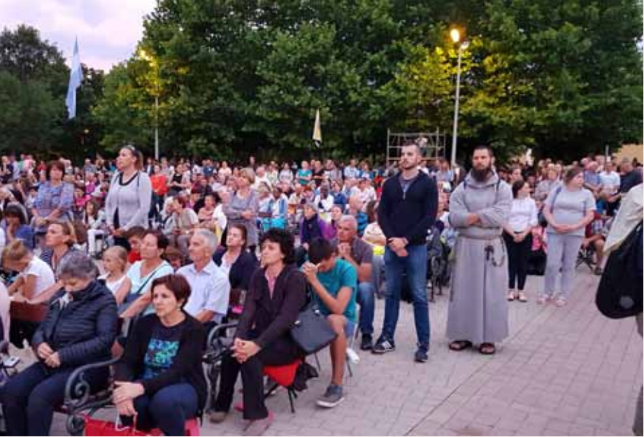
Die Pilger in Medjugorje am Jahrestag 2018

sondern vor allem als den Menschen, der das auch praktisch umsetzte.